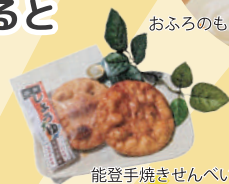
能登手焼きせんべい