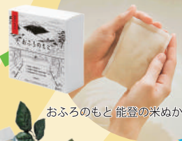
おふろのもと 能登の米ぬか