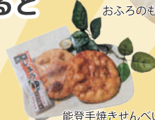
能登手焼きせんべい