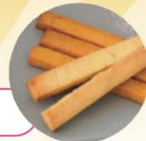
notogocochi ぼりぼりクッキー